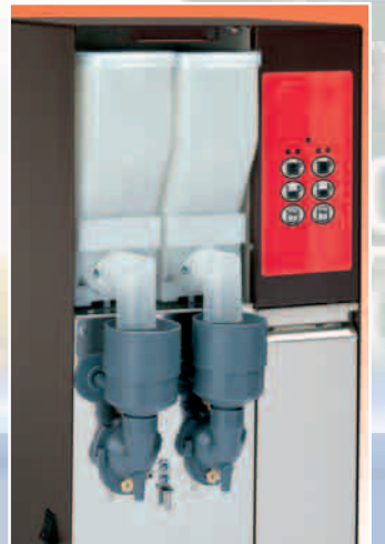
BWAY 2 due gusti, due miscelatori two flavours two mixing units