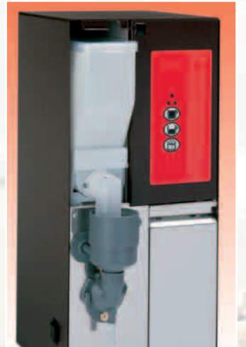
HOTWAY un gusto, un miscelatore one flavour one mixing unit

The perfect solution to obtain in a few seconds a sweet, perfect creamy hot drink.