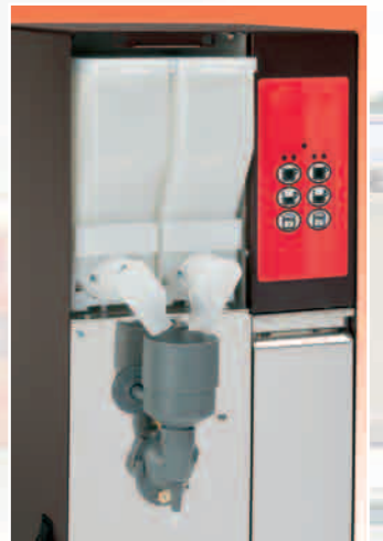
BWAY 1 due gusti, un miscelatore two flavours one mixing unit